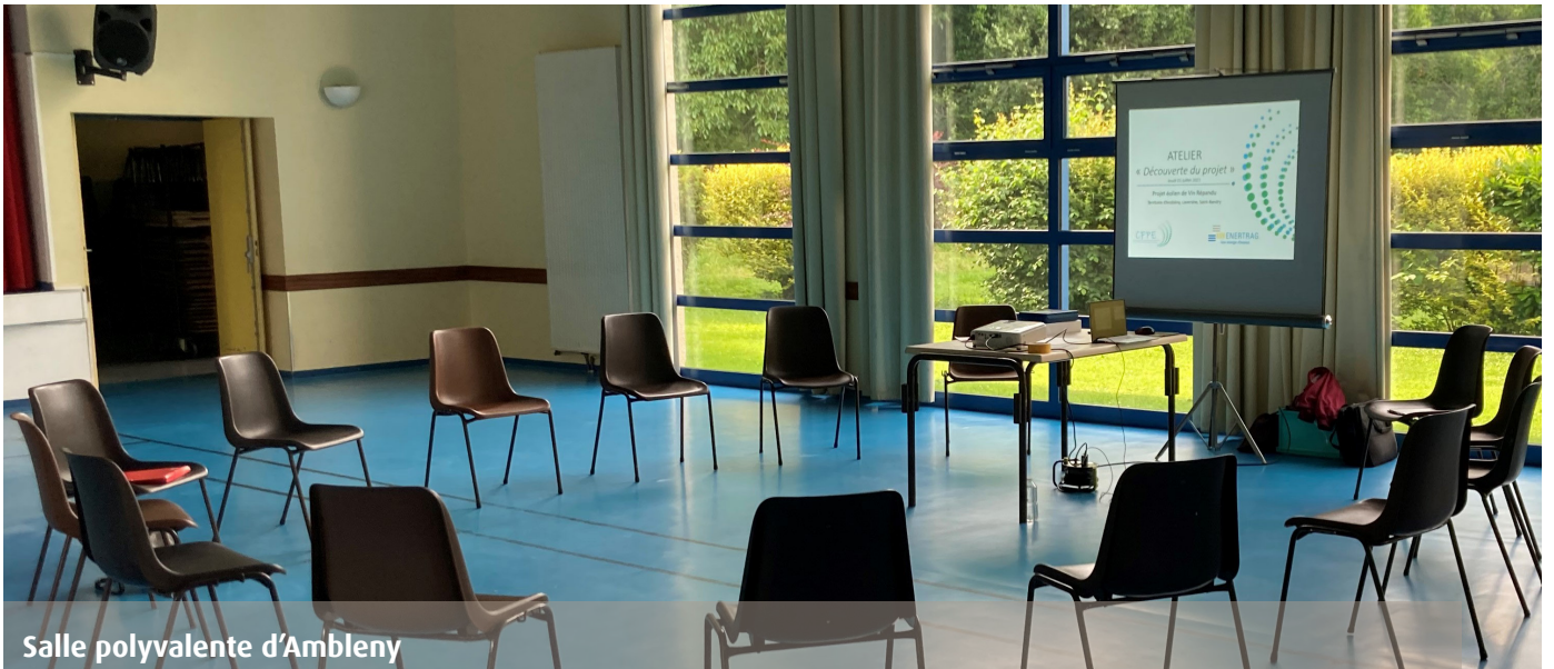
Salle polyvalente d'Ambleny

Chères habitantes, chers habitants de Laversine, Saint-Bandry et Ambleny,