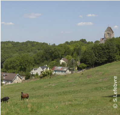
Eglise et vallée de Cutry